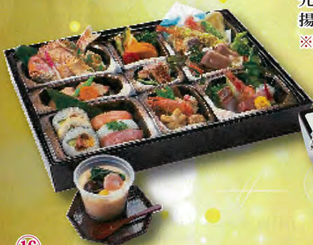
⑯ 湖翠「こすい」 4,860円

先付・お造り・焼物・煮物 揚物・中付・寿司・漬物・フルーツ ※2日前のご注文で承ります