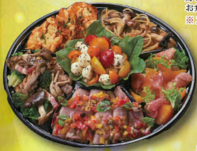
⑱ 洋食オードブル(3人前) 3,500円

ハンバーグ・エビフライ・お寿司 唐揚げ・デザートなどお子様の 好きな物を詰め合わせた贅沢な お弁当です ※2日前のご注文で承ります