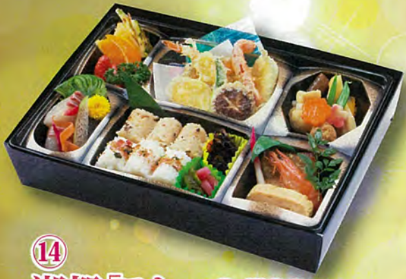
⑭ 湖都「こと」 2,700円