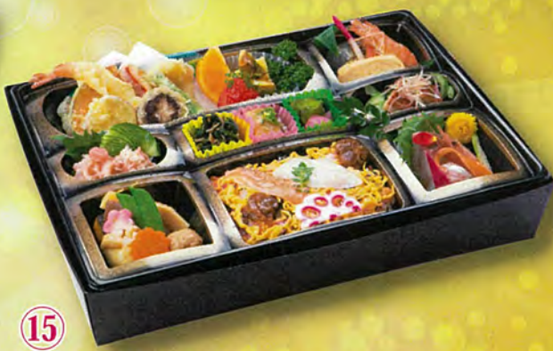
⑮ 湖陽「こはる」 3,780円

先付・お造り・焼物・煮物 揚物・中付・寿司・漬物・フルーツ ※2日前のご注文で承ります